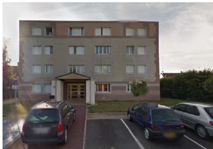
Résidence Les Tilleuls, 19 rue Saint Cyr, 15 logements